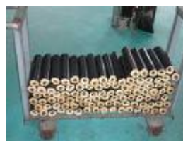
รูปที่ 1.11 แกลบอัดแท่ง