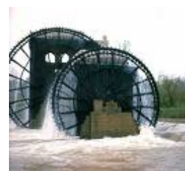
รูปที่ 1.8 Water Wheel

พลังงานน้ำ เป็นรูปแบบหนึ่งการสร้างกำลังโดยการอาศัยพลังงานของน้ำที่เคลื่อนที่ ปัจจุบันนี้พลังงานน้ำส่วนมากจะถูกใช้เพื่อใช้ในการผลิตไฟฟ้า นอกจากนี้แล้วพลังงานน้ำยังถูกนำไปใช้ในการชลประทาน การสี การทอผ้า และใช้ในโรงเลื่อย พลังงานของมวลน้ำที่เคลื่อนที่ได้ถูกมนุษย์นำมาใช้มานานแล้วนับศตวรรษ โดยได้มีการสร้างกังหันน้ำ (Water Wheel) เพื่อใช้ในการงานต่างๆ