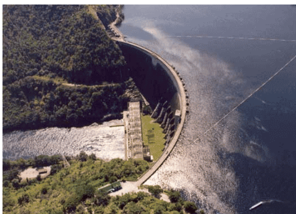
รูปที่ 1.9 เขื่อนภูมิพล

4. การสร้างเขื่อนเพื่อผลิตกระแสไฟฟ้า กักเก็บน้ำและทดน้ำให้สูงขึ้น สามารถช่วยกักน้ำเอาไว้ใช้ในช่วงที่ไม่มีฝนตก ทำให้ได้แหล่งน้ำขนาดใหญ่สามารถใช้เลี้ยงสัตว์น้ำหรือใช้เป็นสถานที่ท่องเที่ยวได้ และยังช่วยรักษาระบบนิเวศของแม่น้ำได้โดยการปล่อยน้ำจากเขื่อนเพื่อให้น้ำไหลลงไปในแม่น้ำที่เกิดจากโรงงานอุตสาหกรรม นอกจากนี้ยังสามารถใช้ให้น้ำเค็มซึ่งขังขึ้นมาจากทะเลก็ได้