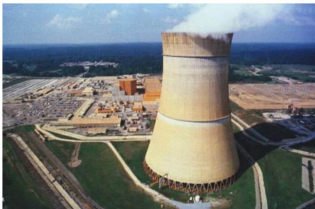
รูปที่ 1.12 โรงไฟฟ้านิวเคลียร์