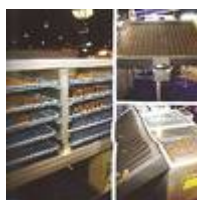
รูปที่ 1.4 การอบแห้ง

2. การนำความร้อนพลังงานแสงอาทิตย์มาใช้โดยตรง เช่น ระบบอบแห้งพลังงานแสงอาทิตย์ ระบบผลิตน้ำร้อนพลังงานแสงอาทิตย์ เป็นต้น