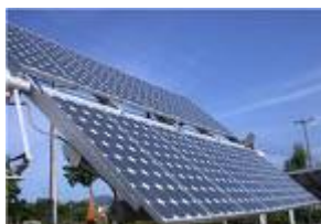
รูปที่ 1.2 แผงโซลาร์เซลล์

1. การนำพลังงานแสงอาทิตย์มาผลิตไฟฟ้า โดยใช้เซลล์แสงอาทิตย์ (Solar Cell) เป็นตัวกลางในการเปลี่ยนพลังงานรังสีดวงอาทิตย์ให้เป็นพลังงานไฟฟ้า