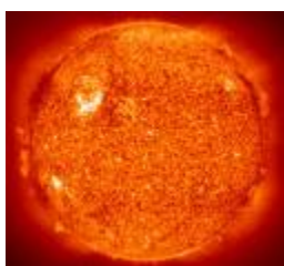
รูปที่ 1.1 การแผ่รังสีจากดวงอาทิตย์

พลังงานแสงอาทิตย์เป็นพลังงานแผ่รังสีจากดวงอาทิตย์ พลังงานนี้เป็นต้นกำเนิดของวัฏจักรของสิ่งมีชีวิต ทำให้เกิดการหมุนเวียนของน้ำและธาตุต่างๆ เช่น คาร์บอน พลังงานแสงอาทิตย์จัดเป็นหนึ่งในพลังงานทดแทนที่มีศักยภาพสูง ปราศจากมลพิษ อีกทั้งเกิดใหม่ได้ไม่สิ้นสุด