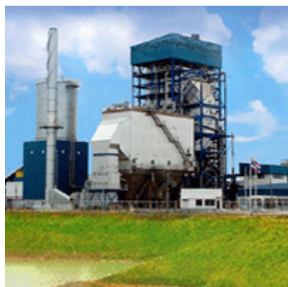
รูปที่ 1.10 โรงไฟฟ้าชีวมวล