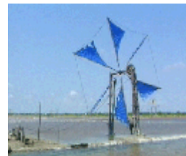
รูปที่ 1.6 กังหันลมสูบน้ำ

การใช้กังหันลมเพื่อการสูบน้ำ ปัจจุบันได้มีการติดตั้งใช้งานในประเทศไทยไม่น้อยกว่า 6,000 ตัว