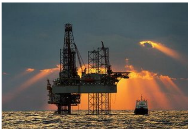
รูปที่ 1.16 แท่นขุดเจาะปิโตรเลียมและก๊าซธรรมชาติ