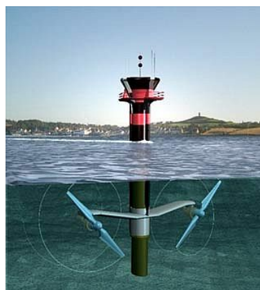
รูปที่ 1.15 กังหันน้ำขึ้นน้ำลง