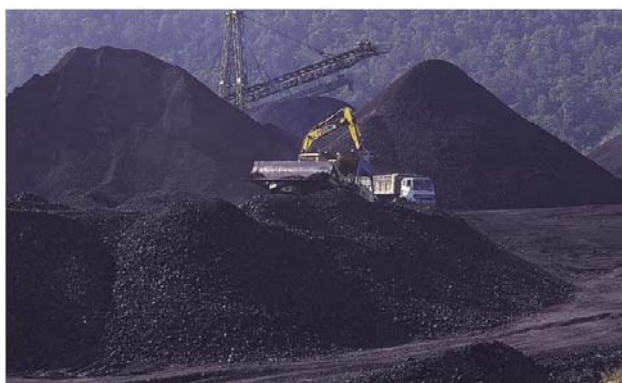
รูปที่ 1.16 เหมืองแร่ถ่านหิน

ถ่านหินที่พบมากที่สุดในประเทศไทยได้แก่ ถ่านหินลิกไนต์ พบที่แม่เมาะ จ.ลำปาง และจ.กระบี่ จัดว่าเป็นลิกไนต์ที่คุณภาพแย่มากที่สุดในประเภทถ่านหินลิกไนต์พบว่าส่วนใหญ่มีค่าคาร์บอนอยู่มากแต่มีกำมะถันเพียงเล็กน้อย องค์ประกอบพอสรุปได้ว่ามีคาร์บอนคงที่อยู่ระหว่างร้อยละ 41 – 74 ปริมาณความชื้นอยู่ระหว่างร้อยละ 7 – 30 และเถ้าอยู่ระหว่างร้อยละ 2 – 45 โดยน้ำหนัก