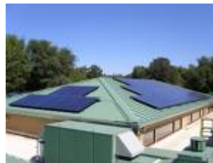
รูปที่ 1.3 บ้านใช้พลังงานจากดวงอาทิตย์

2. การนำความร้อนพลังงานแสงอาทิตย์มาใช้โดยตรง เช่น ระบบอบแห้งพลังงานแสงอาทิตย์ ระบบผลิตน้ำร้อนพลังงานแสงอาทิตย์ เป็นต้น