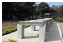
รูปที่ 1.5 ระบบผลิตน้ำร้อน