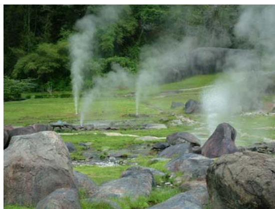
รูปที่ 1.13 บ่อน้ำพุร้อน